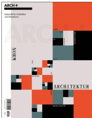
ARCH+ 233 Norm-Architektur – Von Durand zu BIM November 2018