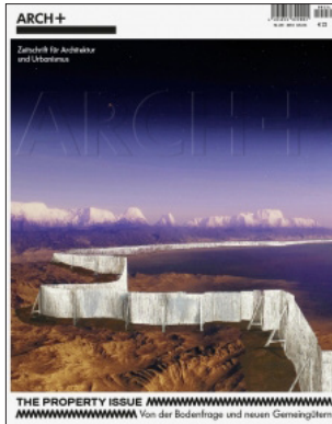
ARCH+ 231 The Property Issue – Von der Bodenfrage und neuen Gemeingütern April 2018