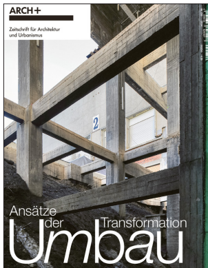
ARCH+ 256 Umbau – Ansätze der Transformation Juli 2024