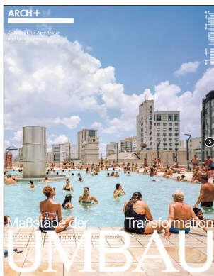
ARCH+ 257 Umbau – Maßstäbe der Transformation September 2024