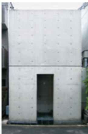
Tadao Ando, Row House (Azuma House), Osaka, 1975/76