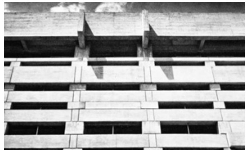
Kenzo Tange, Rathaus von Kurashiki, 1960. Der Stahlbetonbau evoziert das Bild des traditionellen japanischen Holzbaus.

Dagegen treffen Aufzugsschacht und Treppenhaus unvermittelt mit dem ansonsten durch und durch ja-