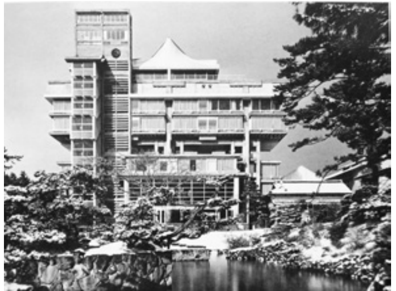
Kiyonori Kikutake, Tokuon Hotel, Tottori, 1963-64. Das Gebäude spiegelt ein Bild buddhistischer Tempelarchitektur wider.

Isozakis traumatische Abgründe sind gleichsam auch die traumati-