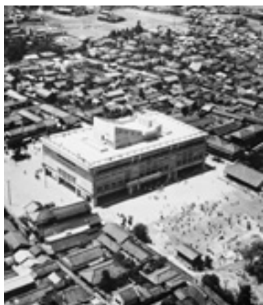
Die Spiegelung der nationalen Traumata in der Architektur. Kenzo Tange, Rathaus von Kurashiki, 1960

Mit der „Überwindung der Moderne“ glaubte man, eine eigene, asiatisch bzw. japanisch geprägte Moderne definieren zu können. Die Polemik war einerseits gegen die euro-