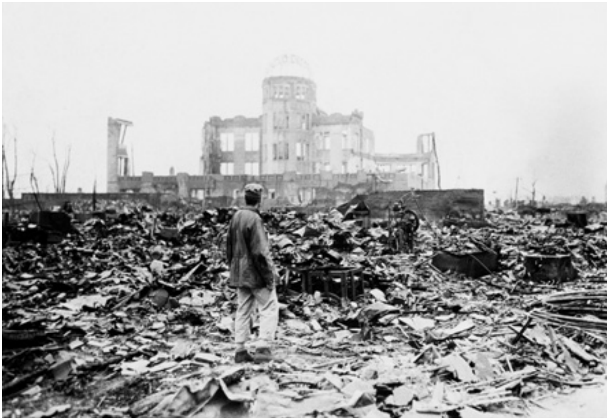
Im Hintergrund die Ruine des Gebäudes der japanischen Industrie- und Handelskammer in Hiroshima, die später als Friedensdenkmal auch unter dem Namen „Atombombendom“ bekannt wurde. Die Aufnahme entstand einen Monat nach dem Abwurf der Atombombe 6. August 1945.

päische Moderne als Vorbild für Japan gewandt, sie richtete sich aber auch gegen das Modernisierungsparadigma, das seit der Öffnung Japans um die Mitte des 19. Jahrhunderts herum praktiziert wurde. Die Formel hieß wakon – yosai oder „japanischer Geist und westliche Technik“. Unter dieser Formel wakon – yosai , wurde die westliche Technik willkommen geheißen, gleichzeitig aber deren Überhöhung durch die japanische Kultur gefordert. 1942 hatte sich das Ziel geändert und man wollte die Verbindung zur westlichen Moderne aufkündigen und ein eigenes asiatisches Modell der Moderne entwickeln, eine Art „alternative“ oder „andere“ Moderne. Doch 1945 und damit nur 3 Jahre später fand sich Japan zu einer noch engeren Allianz mit dem Westen gezwungen als je zuvor in seiner Geschichte: Japan hatte zum ersten Mal in seiner langen Geschichte einen Krieg verloren, war zum ersten Mal von fremden, dazu noch westlichen Truppen besetzt, es sah sich zum ersten Mal in seiner Geschichte seiner politischen Autonomie beraubt, und war durch den Einfluss der Besatzungstruppen in seiner kulturellen Souveränität aufs äußerste bedroht. Man war also noch enger an den Westen gebunden als je zuvor.