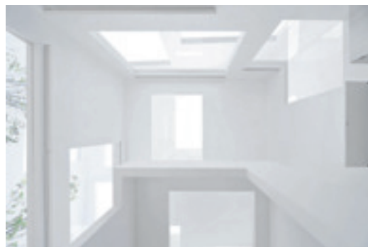
Sou Fujimoto Architects, Haus N, Oita 2008.

Die neue japanische Architektengeneration ist weitgehend frei von den japanischen Traumata der Modernisierung, wie sie die ältere Generation geprägt haben.