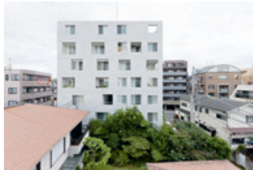
Go Hasegawa and Associates, Apartment in Nerima, Tokio, 2010.