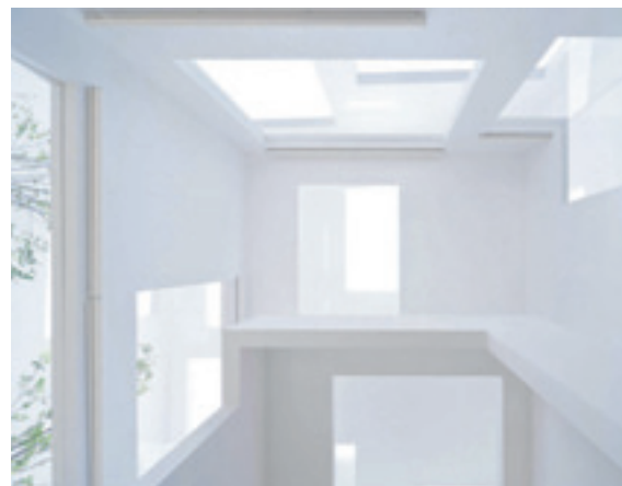
Sou Fujimoto Architects, Haus N, Oita 2008.