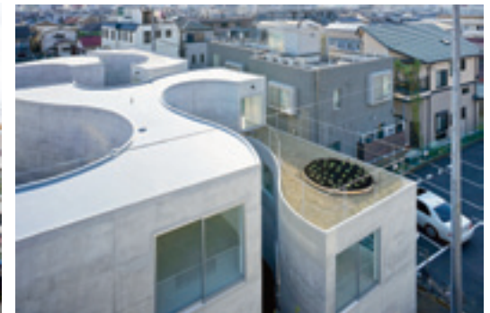
Kazuyo Sejima & Associates, Okurayama Apartment, Yokohama 2008.