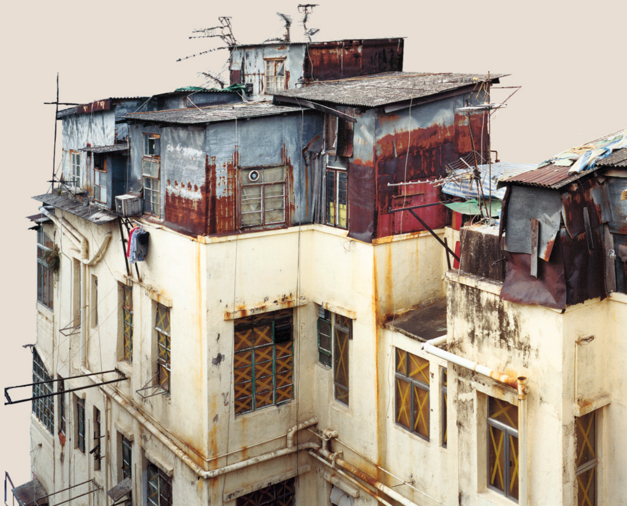
Foto links: Hongkong, aus: Rufina Wu, Stefan Canham: Portraits from Above. Hong Kong's Informal Rooftop Communities, Peperoni Books, 1. Auflage 2008, S. 15 Foto rechts: New York, aus: Alex MacLean: Über den Dächern von New York. Die verborgenen Oasen der Stadt, Schirmer/Mosel Verlag, München 2012, S. 40

Wohnverhältnisse sind Lebensverhältnisse. Sie geben Auskunft über die tatsächliche Lebenslage der Menschen und sie beeinflussen in erheblichem Maße ihre Befindlichkeit. Wohnverhältnisse bilden die ökonomischen und sozialen Verhältnisse ab. Wo und wie gewohnt wird, schafft Bedingungen, die sich auf die objektiven Lebenschancen eines Jeden auswirken und die seine subjektive Lebenswirklichkeit prägen.